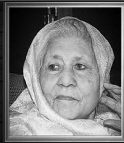
ਬਾਨੋ ਕੁਦਸੀਆ ਵਿਸ਼ੇਸ਼ ਅੰਕ