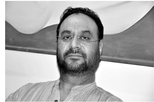
ਦਮ ਘੱਟੂ ਹੁੰਦਾ ਜਾ ਰਿਹਾ

ਚਿਮਨੀ, ਕਾਰ ਜਾਂ ਹੋਰ ਕਿਤੋਂ ਉੱਠਿਆ ਗੁਬਾਰ ਬਨਸਪਤੀ ਰੁੱਖ ਜੀਆ ਜੰਤ ਤੇ ਨਾਂ ਧਰਤੀ ਸਭ ਕਸਮਸਾ ਕੇ ਰਹਿ ਗਏ ਲਾਚਾਰੀ ਤੇ ਸਹਿਮ 'ਚ ਸਭ